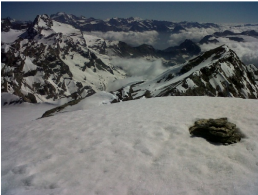
Sommet de la Francesetti

Sur le retour, arrêt au bistrot pour du cidre et des crêpes, histoire de prolonger ce merveilleux week-end.