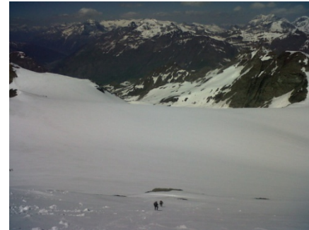
Le glacier du Grand Fond