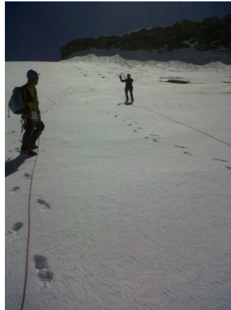
... vu d'en bas