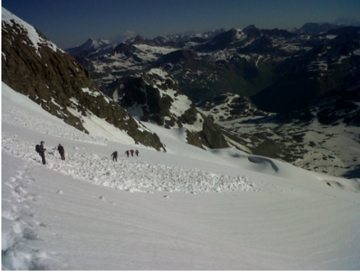
Montée vers la Selle, grosses avalanches de fond