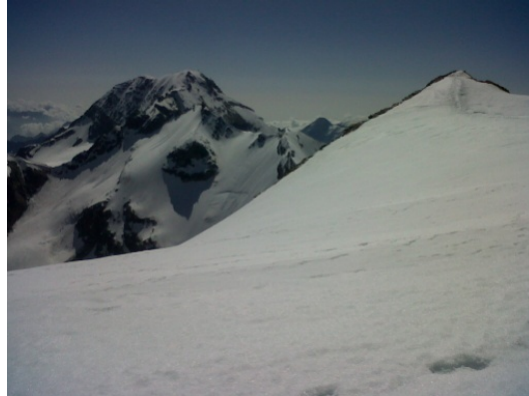
Sortie d'arête et vue sur les petite et grande Ciamarella