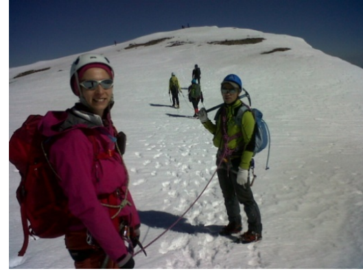
L'équipe juste avant le sommet